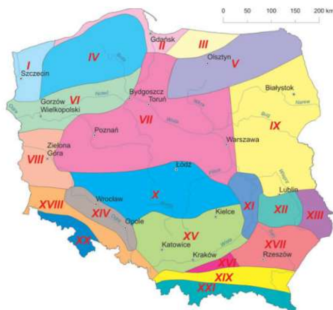
Dzielnice rolniczo-klimatyczne Polski (oznaczenia jak w tabeli)