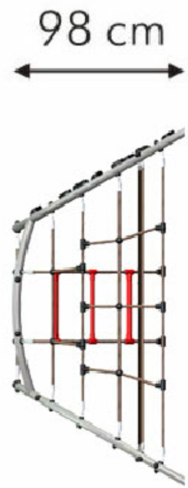
ZABAWKI TERENOWE: MAŁY TATERNIK